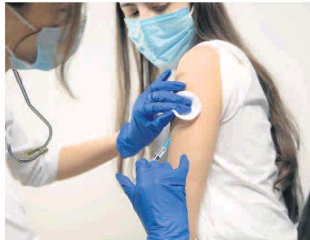
La vacunación es la medida más eficaz de prevención.