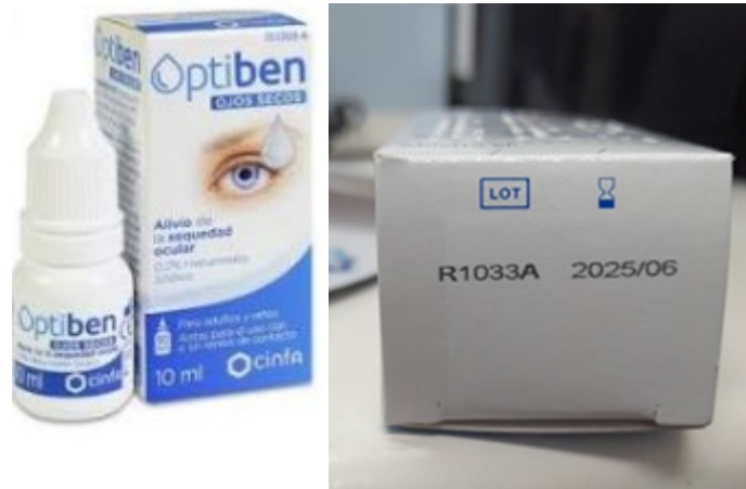
Figura 1. Posición del número de lote en el envase de Optiben Ojos Secos 10 ml.

Optiben ojos secos 10ml número de lote R1033A (figura 1 y 2).