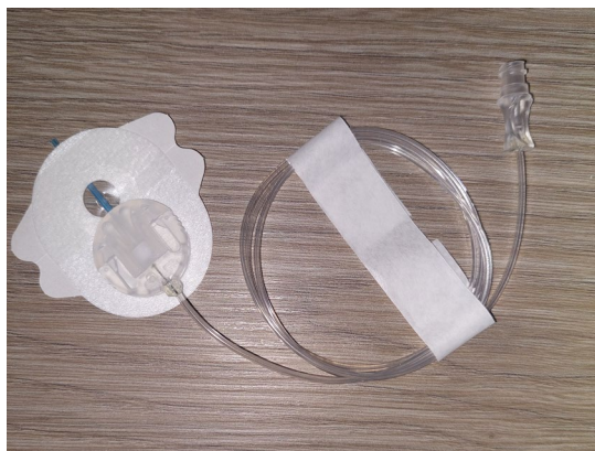
Figura 1: Equipo de infusión VariSoft